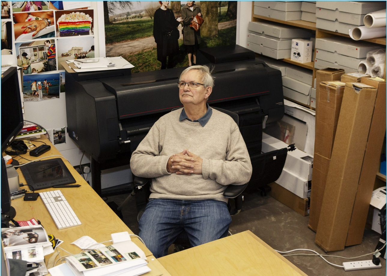
Pause zuhause an seiner Werkbank