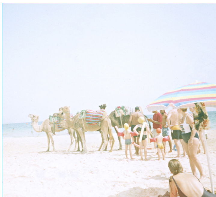
o.T., aber am Strand

organisieren. Und ich werde treu meine Beiträge zahlen, schon allein damit Mirko sein vorgelegtes Geld zurückbekommt.