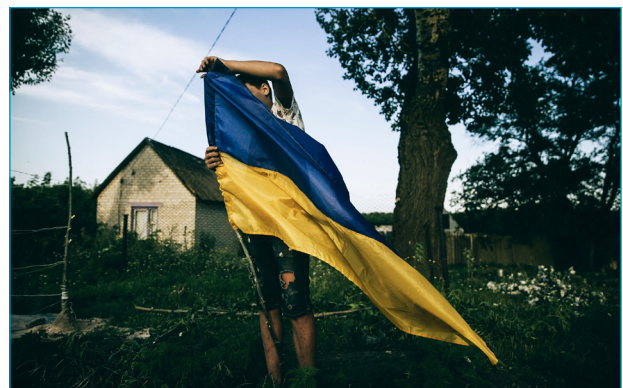
A teenager is setting a checkpoint in the village of Zelene in the Kharkiv region 2022

Immer einen Besuch wert ist das FOAM in der Keizersgracht 609 in Amsterdam . Bis in den Mai läuft noch Jasmijn Vermeeren' » You Don't Look Sick «, und ab dem 5. März gibt es neben provokanten Bildern von Verena Blok unter dem Titel » Love Shit « eine Vernissage » War is Personal « mit Fotos Julia Kochetova aus den ukrainischen Kriegsgebieten. Dazu FOAM: »Während internationale Medien Krieg oft auf Statistiken reduzieren, richtet Kochetova ihren Blick auf das persönliche Leben hinter den Statistiken: auf die Häuser, die Menschen, die zurückbleiben, und ihre Sprache. Sie macht die persönlichen Realitäten des Konflikts greifbar und konfrontiert die Besucher mit Fragen zu Erinnerung, Überleben und der Bedeutung von Heimat, während der Krieg weitergeht.« Die WorldPressPhoto-Gewinnerin 2024 wird zur Vernissage anwesend sein.