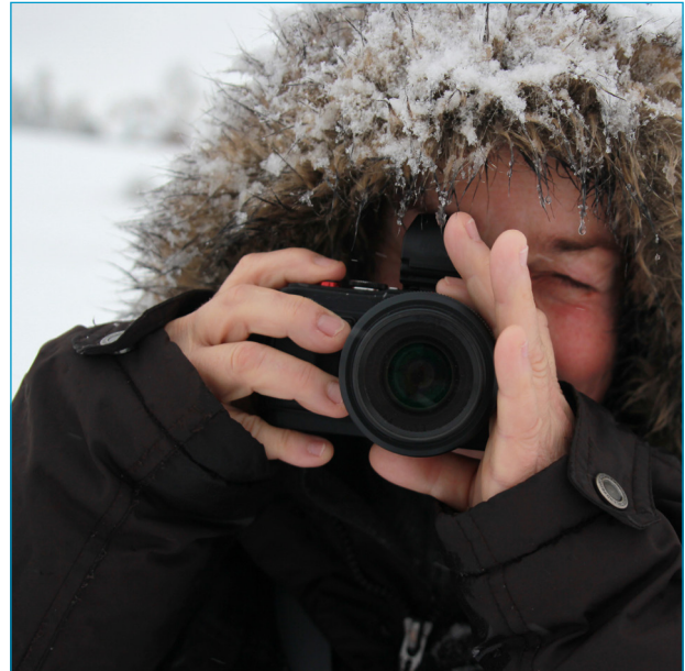
Feinjustierung bei Minusgraden: pancake © time., Allgäu 2014

Ach ja: Unterstreichungen verlinken auf weiterführende Hinweise, blaue Begriffe sind thematische Eyecatcher.