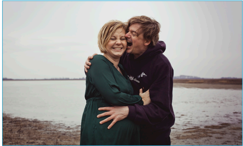
Lieblingmenschin mit Hans im Bauch © John Krepl, Neusiedlersee, 2018

Die Community kann in erster Linie lange Antworten auf kurze Fragen voller ungewöhnlicher Konjunktive, die Leser*innen an den Rand des Wahnsinns brächten, wenn ich sie verwendete,