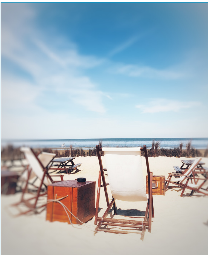
Blick ins Blaue © Carlitos, 2025

und einen inflationären Einsatz von Futur II – meiner Lieblingszeitform –, den es im Übermaß gegeben haben wird und der quasi Ausdruck eines von mir geliebten grammatikalischen Retrofuturismus ist, sowie unterhaltsame, begeisterte und begeisternde Beatles-Anekdoten, Zuspammung mit Infos zu meiner Band Love God Chaos , Krepl und Ähnliches erwarten. Äh. Wie war nochmal die Frage?