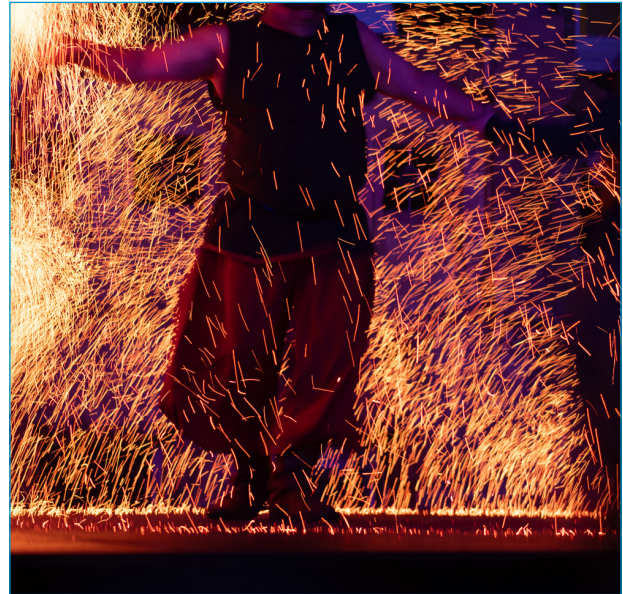
Da fliegen die Funken

In diesem Sinn kann die Community bei mir mit reger Beteiligung bei Kommentaren etc. rechnen. Weniger sehe ich mich als Veranstalterin von regionalen Angeboten, vor allem, weil ich eben, wie erwähnt, total laienhaft fotografiere und daher