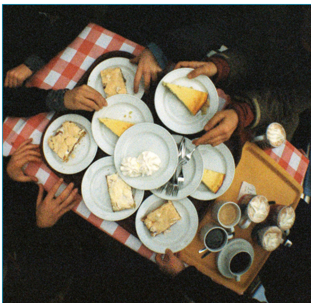
Runde Sache mit Sahne, Dangast-Tour 2009

Jemand hatte vorgeschlagen, Lieblingslocations zu posten. Da bin ich aber eher zurückhaltend, da ich meine besonderen Plätze nicht unbedingt im Internet veröffentlichen möchte. Wenn mich allerdings gezielt jemand fragt, wo es denn in meiner Region Chiemgau abseits der allgemeinen »Rummelplätze« besonders ist, dann gebe ich gern Auskunft und Tipps.