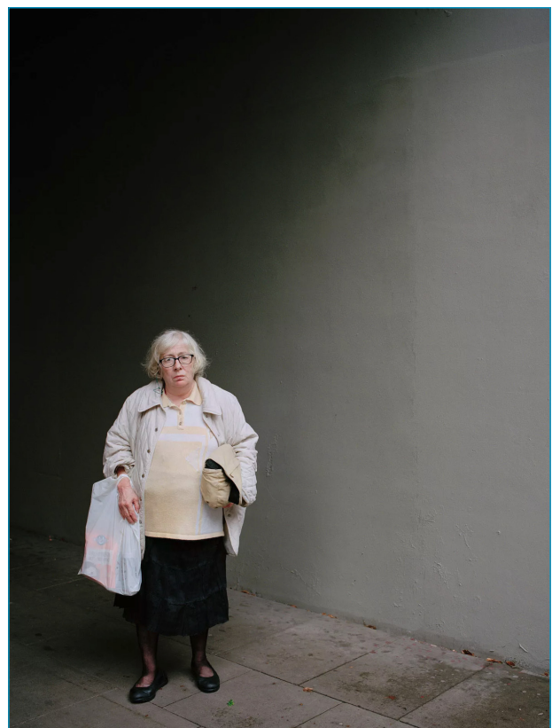
aus der Serie »Hamburg Barmbek-Nord«