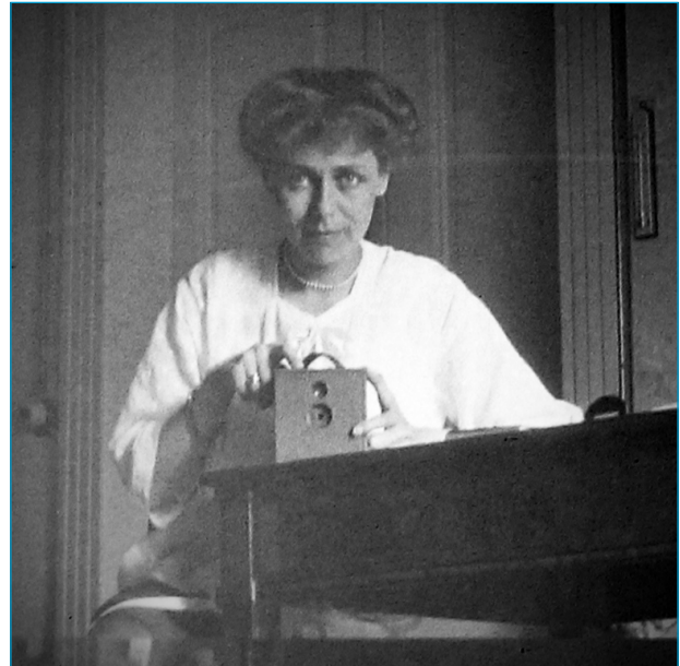
Selfie 1916 mit Lochkamera und Spiegel © Archiv time.

Unterstreichungen verlinken auf weitere Hinweise, blaue Begriffe sind thematische Eyecatcher. Und weiterhin gilt: eine Mitgliedschaft im Verein LightDeck bedeutet eine wertvolle Unterstützung für unsere Arbeit und trägt zur Absicherung des Projektes bei. Ganz klar: Die Mitgliedschaft ist und bleibt freiwillig – wir freuen uns aber natürlich über alle Anträge und jede Form der besonderen Unterstützung auf unser Konto: LightDeck e.V., DE52 8306 5408 0006 8781 56, SKAT-Bank.